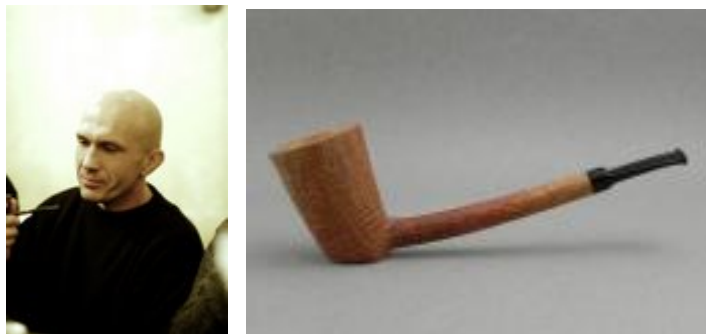
Shekita: Mais um artesão do Leste

Há diferentes métodos e teorias sobre a melhor forma de encher e acender o nosso cachimbo. Aqui fica um exemplo, através de imagens em vídeo com explicação em inglês: http://www.oldtoby.com/ .